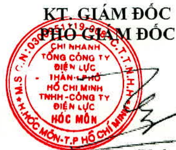
Trần Hưng Phú